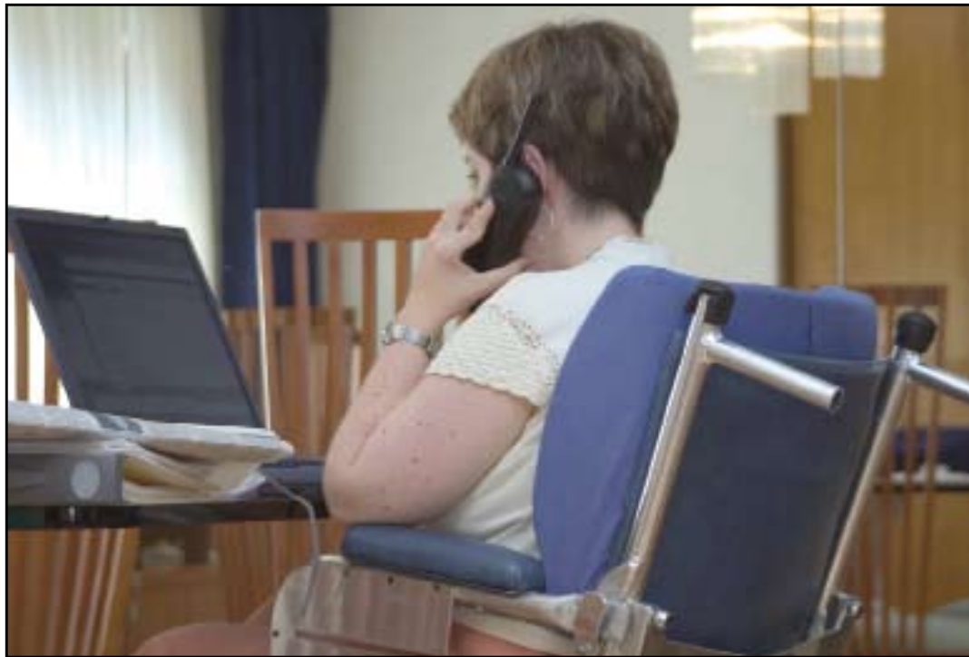
Des aides matérielles pour accéder aux contenus d'Internet.